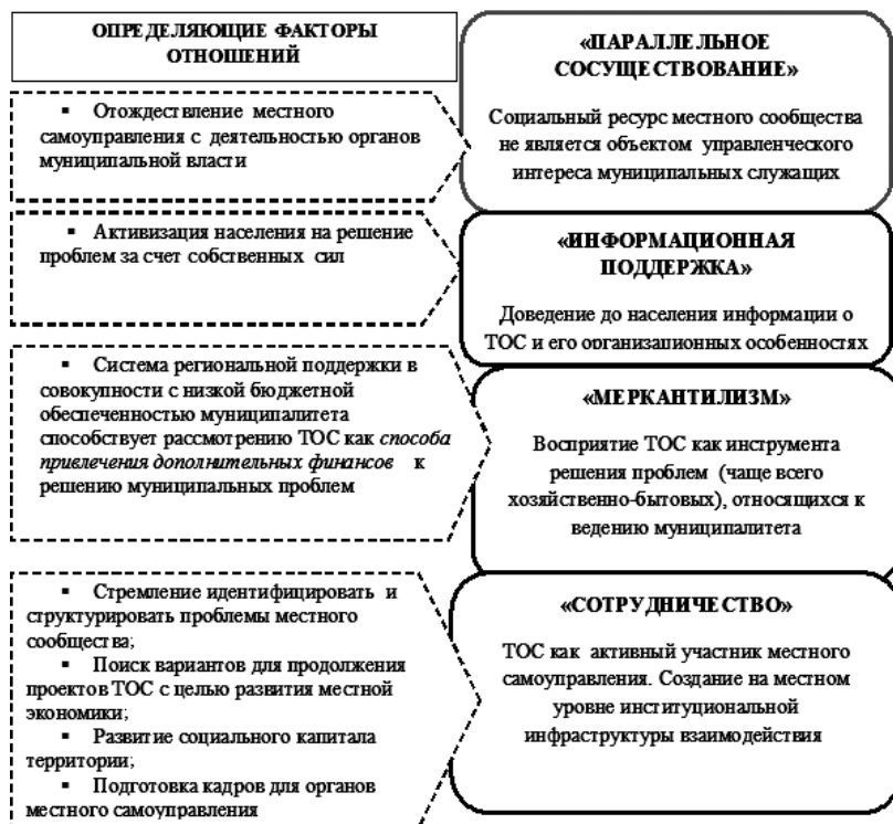
Рис. 2. Трансформация отношения органов местного самоуправления к ТОС

По оценкам экспертов, на практике доминируют позиции, обозначенные как «информационная поддержка» и «меркантилизм». Однако перспективы развития ТОС мы связываем с моделью «сотрудничество», которая предполагает активное вовлечение ТОС в местную политику,