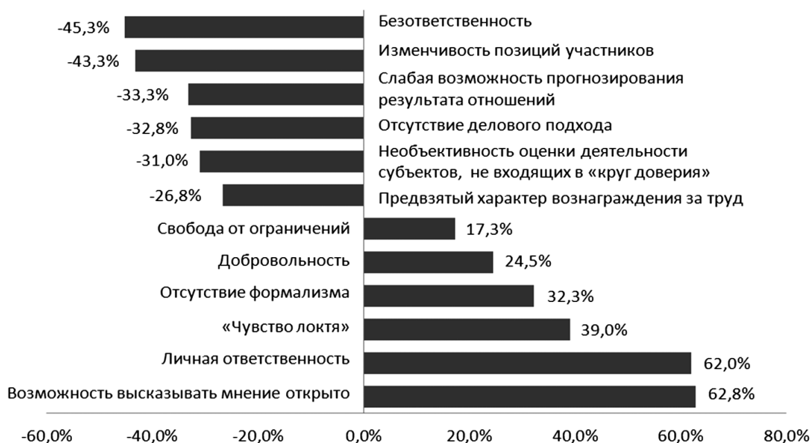
Рис. 2. Отрицательные и положительные стороны построения отношений «на доверии» для сельских жителей (в сумме больше 100 %, т. к. допускался выбор нескольких вариантов ответа)

ответственность. В то же время главные недостатки таких отношений, отмеченные респондентами, – безответственность и изменчивость позиций участников.