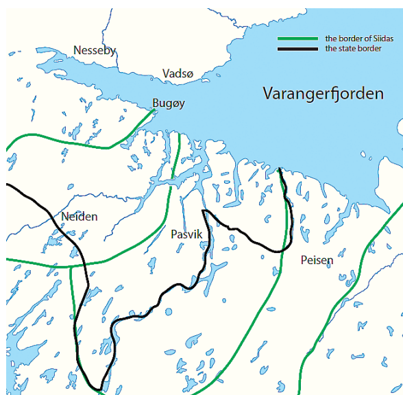
Рис. 1. Карта российско-норвежской границы 1826 года: — — линия государственной границы, — — границы саамских сийит 1