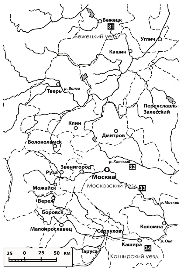
Рис. 2. Вотчины Соловецкого монастыря в центральных уездах

Солеварение исторически являлось основным источником дохода монастыря, однако во второй половине XVII века промыслу был нанесен серьезный урон в результате печально известного «соловецкого сидения» 1668–1676 годов. Едва последствия временного запустения монастырских вотчин были преодолены, соляной промысел обители попал под действие указа Петра I (1705 год) о государственной монополии на продажу соли. Всех солепромышленников обязали заключать контракты с государством, согласно которым они должны были поставлять определенное количество соли в конкретные соляные комиссарства по установленной государством цене. Частная продажа соли, а также